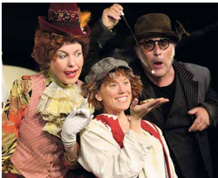
Katze und Fuchs meinen es wohl nicht nur gut mit dem naiven Pinocchio.

Ebenfalls für Kinder ab 4 Jahren bringt die «Märchen-Bühne Bern» eine Geschichte aus der Märchen-Sammlung der Gebrüder Grimm in den Theatersaal des Hotels Natio-